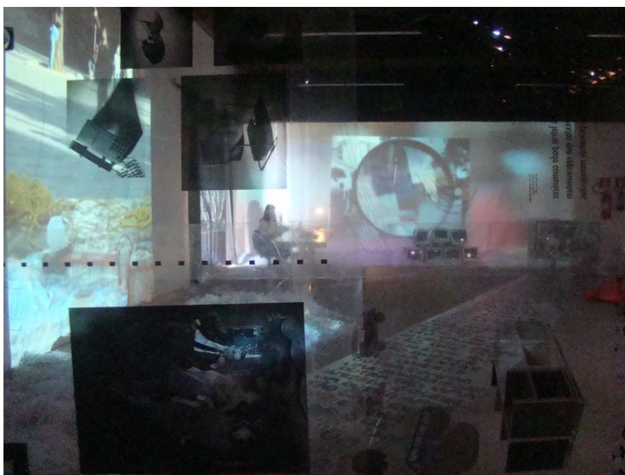
Instalação “Num dado e-vento: biotecnologias e culturas em texturas, vãos, cores, sombras, sons...”.

que perfuram o cenário habitual, que fissuram a paisagem que estava dada. A produção musical final de João Arruda nos convida a pensar e a sentir a possibilidade de não haver um som que seja próprio das biotecnologias. Que tempo poderia nascer da perda de propriedade, da perda de identidade? Sons ao e-vento e não do e-vento. Sons que se oferecem ao e-vento e que anunciam um despertencimento. Que não querem ilustrar as biotecnologias, a divulgação científica. Que não desejam captar delas o que possa transmitido. Mas que antes se oferece a elas, cria com elas, climas, atmosferas, paisagens nunca ouvidas. “(...) as paisagens melódicas também deixam de ser apenas melodias que acompanham o percurso de um mapa territorial para se tornarem elas próprias paisagens sonoras: a melodia entrou em devir-paisagem” (Gil, 2008:130).